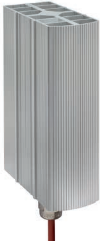
Фото Арт. № 02042.0-00